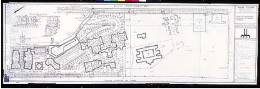
Figure 2: plan de lotissement

La figure 2 superpose la localisation de différents pavillons de l'Université de Montréal au projet de lotissement à des fins résidentielles. On constate qu'en vertu de ce scénario, plusieurs des espaces verts qui ont été préservés grâce à la présence du campus seraient aujourd'hui fragmentés en terrains privés.