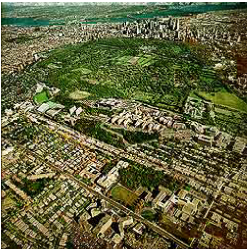
Figure 3: Vue sur la montagne (cliquez l'image pour l'agrandir)

Au fil des ans, l'Université a cherché à concilier ses besoins de développement avec la nécessité de préserver des zones vertes sur son campus. Aujourd'hui c'est près de 60% de tout l'espace du campus (26,9% boisés et 31,5% aires extérieures aménagées) qui est réservé à cette fin (voir figure 3).